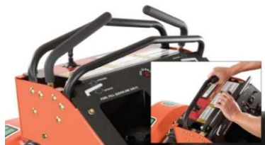
Système Quad Control Handle