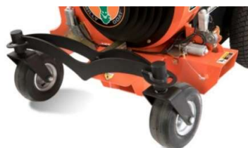
Essieu avant tordu pour une conduite confortable sur des obstacles