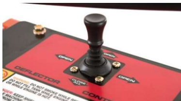
Commande du déflecteur par joystick