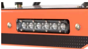
Eclairage de travail LED à l'avant