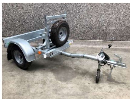
Remorque sur mesure