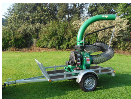
Remorque plateau de charge