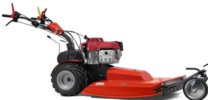
70-PRO C VARIO