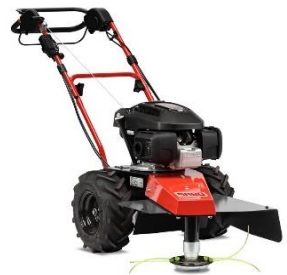
60-PRO T DRIVE