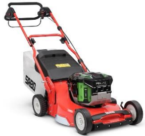
54-PRO E VARIO