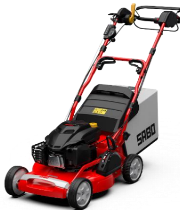
54-K VARIO B