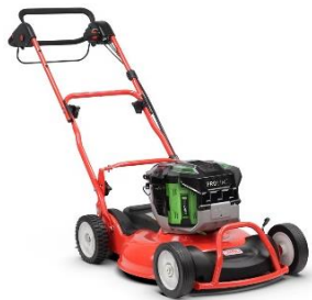
53-PRO E M VARIO