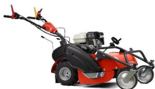
60-PRO F VARIO