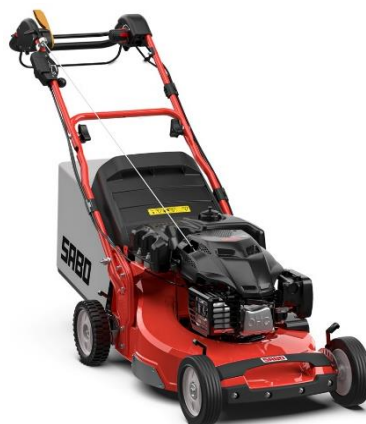
54-PRO K VARIO B PLUS