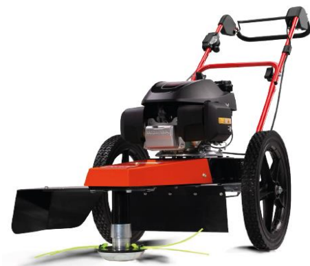
60-PRO T PUSH