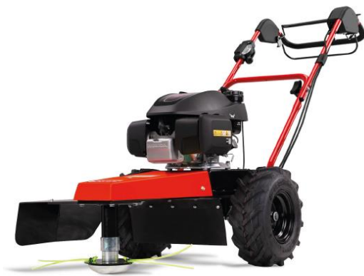
60-PRO T DRIVE