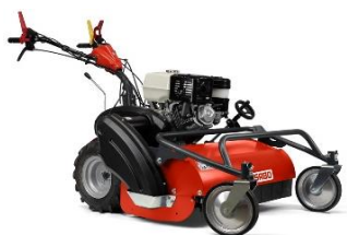
75-PRO F VARIO