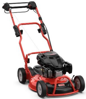
53-PRO M VARIO YAM