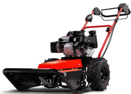
50-PRO C DRIVE