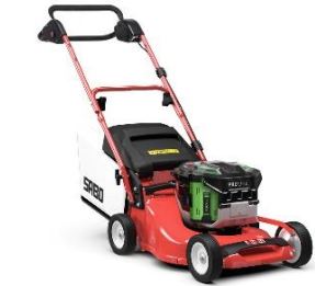
43-PRO E PUSH