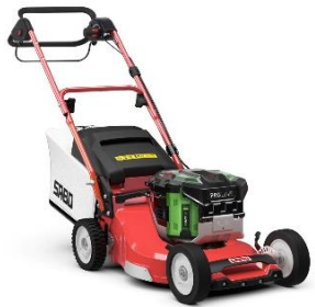
47-PRO E VARIO