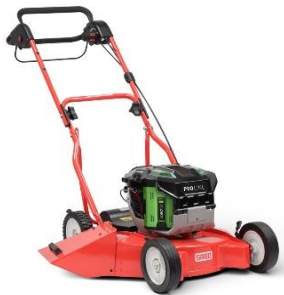
50-PRO E S VARIO