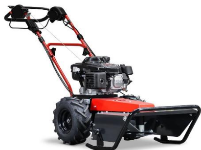
50-PRO C DRIVE