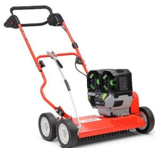
45-PRO E V PUSH