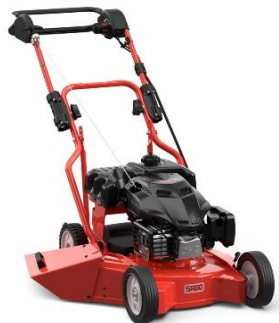
52-PRO S K A PLUS