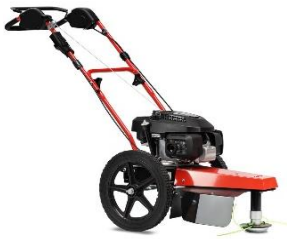
60-PRO T PUSH